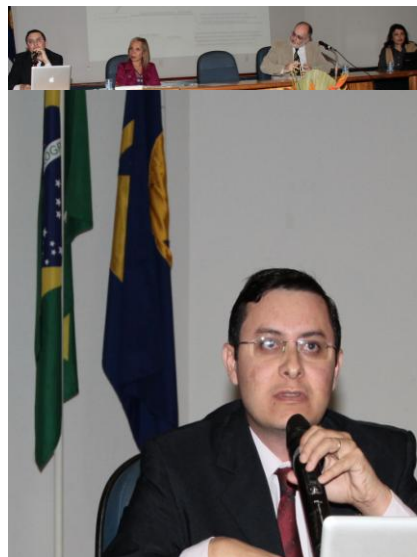
Dr. Luiz Antônio Gouvêa - MinC

Neste eixo macroeconômico, foram ventilados três linhas de atuação: uma voltada para a institucionalização de territórios criativos que vão desde fomentar e dinamizar um bairro com vocação econômica cultural até um consórcio de municípios que também tenham uma convergência cultural, trata-se então de institucionalizar territórios, arranjos produtivos e polos criativos.